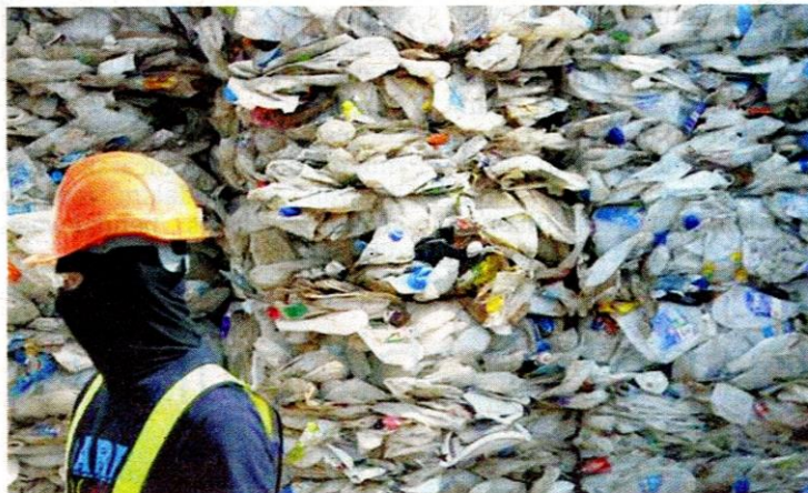
KANADA tidak bercadang untuk mengambil semula sisa bahan buangan plastiknya di Malaysia. - GAMBAR HIASAN

Awal minggu ini, Kanada mengumumkan rancangan untuk mengharamkan penggunaan bahan plastik sekali guna seperti penyedut minuman, beg dan perkakas makanan menjelang awal 2021 bagi mengurangkan bahan tidak boleh dikitar semula serta melindungi lautan dunia. - AGENSI