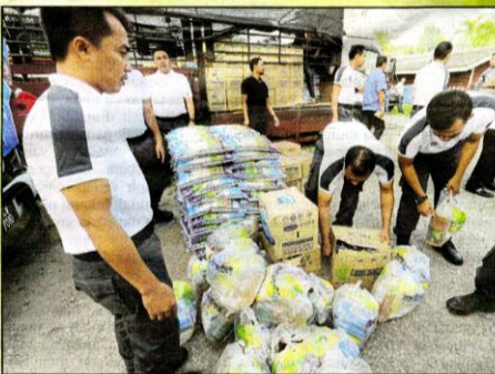
JURACHELWABI menunggang bantuan barangan keperluan dan makanan yang akan diagihkan kepada masyarakat Orang Asli Batek, semalam.

dunia dan menerima rawatan mendapati negatif tibi, kencing tikus, parasit. "Mungkin virus berkenaan merebak dalam kehidupan mereka sejak sekian lama," katanya. Dr Wan Azizah yang juga Menteri Pembangunan Wanita, Keluarga dan Masyarakat berkata, selain rawatan kesihatan, kerajaan juga memberikan kaunseling kepada keluarga mangsa dan petugas bagi mengurangkan keresahan. Terdahulu, beliau menyampaikan sumbangan kepada masyarakat Orang Asli suku Batek yang terjejas dengan penularan penyakit tersebut. Hadir sama Menteri Perdagangan Dalam Negeri dan Hal Ehwal Pengguna Datuk Seri Saifuddin Nasution, Menteri di Jabatan Perdana Menteri Senator P Waytha Moorthy dan Menteri Air, Tanah dan Sumber Asli Dr Xavier Jayakumar.