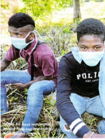
ORANG Asli Batek menggunakan peralatan untuk bagi memastikan tidak terpengaruh penyakit.

faktor keselamatan, mereka tidak dibenarkan menyalurkan sendiri bantuan itu," katanya kepada media selepas meninjau dan mendengar taklimat tertutup di Pusat Operasi Agensi Pengurusan Bencana Negara (NADM) di Dewan Felda Aring 10 di sini, semalam. Dr Wan Azizah yang juga Menteri Pembangunan Wanita, Keluarga dan Masyarakat berkata, kebajikan Orang Asli suku Batek itu terpelihara, namun orang awam tidak dibenarkan menghampiri kawasan itu. "Pihak Kerajaan akan menyalurkan bantuan. Antara barang keperluan yang boleh disumbangkan orang awam dan NGO termasuk air mineral, selimut, ketip kuku dan ubat kuku selain kit kesihatan," katanya. Menurutnya, sumbangan boleh dihantar kepada Pejabat Kebajikan Masyarakat Gua Musang dan pusat pengumpulan bantuan di kawasan operasi. Ditanya sama ada pampasan akan diberikan kepada keluarga Orang Asli yang meninggal dunia, beliau berkata, perkara itu akan dipertimbangkan.