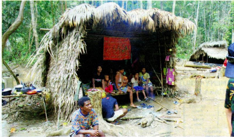
MASYARAKAT Orang Asli kaum Batek ini masih mengamalkan kehidupan berpindah-randah tetapi sekarang sudah ada yang tidak atau pun separuh nomad.

Ia perlu melibatkan sama kumpulan profesional dan pemegang taruh serta pemimpin komuniti di kawasan terlibat. Akta yang