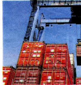
Kontena yang sepatutnya mengandungi kertas skrap bersih dipulangkan ke AS.