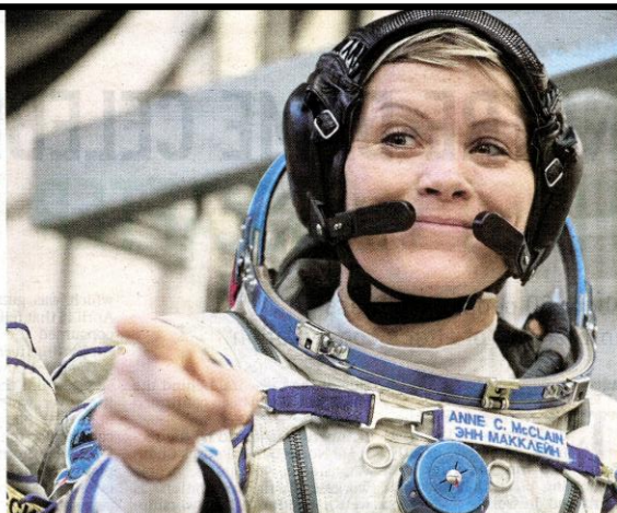
Nasa astronaut Anne McClain attending her final exam at the Gagarin Cosmonauts' Training Centre in Star City outside Moscow. She is one of 12 Nasa female astronauts expected to be chosen for the agency's Artemis programme.

"Now personally, I'd be okay with flying a