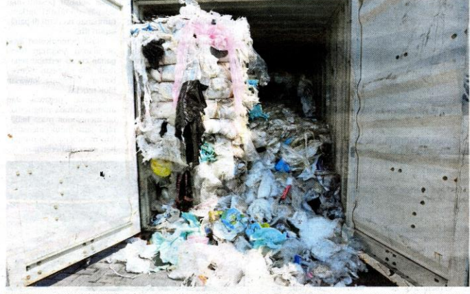
KONTENA mengandungi sisa plastik dari negara Jepun, Australia, Amerika Syarikat, Bangladesh, Canada, China, U.K, Arab Saudi yang dihantar semula di Pelabuhan Barat.

dibawa masuk dari Kanada namun pihak berkuasa Kastam negara berkenaan mengesan sebahagiannya diisytihar sebagai plastik kitar semula, namun pemeriksaan mendapati ia dipenuhi sampah isi rumah, peralatan elektronik termasuk lampin. "Sebanyak 34 daripada jumlah itu dilupuskan selepas menerima kecaman daripada kumpulan alam sekitar tempatan," katanya. Aktivitis menerusi Gabungan EcoWaste dan RightOnCanada dalam kenyataannya menganggap penghantaran semula sampah ke Kanada adalah kemenangan terhadap undang-undang moral dan alam sekitar.