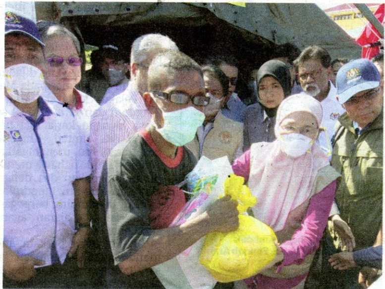
DR. WAN AZIZAH WAN ISMAIL menyampaikan bekalan makanan kepada penduduk Orang Asli Kuala Koh di Gua Musang, semalam. Turut hadir Saifuddin Nasution Ismail.

Terdahulu, Dr. Wan Azizah mendengar taklimat tertutup serta menyampaikan sumbangan kepada masyarakat Orang Asli suku Batek di Pusat Operasi Agensi Pengurusan Bencana Negara (NADMA) di Dewan Fel-da Aring 10 di sini hari ini.