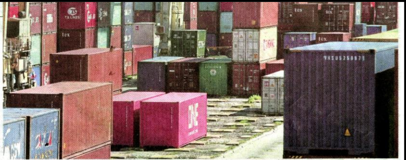
Ratusan kontena yang mengandungi sisa plastik dibawa masuk dari beberapa negara maju termasuk Jerman, Amerika Syarikat dan Perancis di Terminal Kontena Butterworth Utara (NBCT) di Butterworth.

Butterworth: Sebanyak 132 kontena mengandungi sisa plastik dan sampah yang dibawa masuk menerusi Pulau Pinang sejak awal bulan ini masih tersadai di Pelabuhan Kontena Butterworth Utara (NBCT) di sini. Sebelum ini, sebanyak 265 kontena yang juga mengandungi sisa plastik dan sampah tersadai di pelabuhan sama sejak Januari lalu. Pengarah Jabatan Kastam Diraja Malaysia (JKDM) negeri, Datuk Saidi Ismail, berkata pihaknya mendapati berlaku pertambahan kemasukan kontena mengandungi sisa