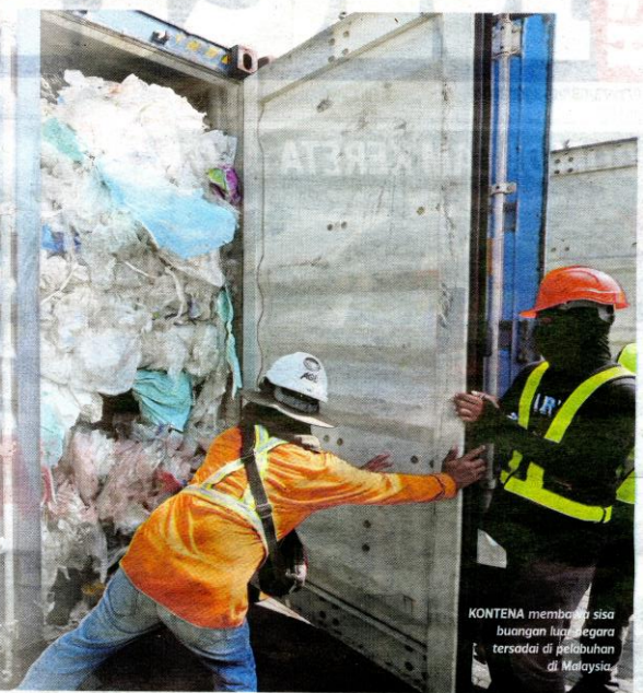
KONTENA membawa sisa buangan luar negara tersadai di pelabuhan di Malaysia

berapa banyak daripada sisa plastik berkenaan berasal dari Kanada.