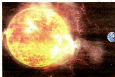
Matahari menghasilkan 'Superflares' setiap 1,000 tahun atau lebih dan boleh ancam dunia.