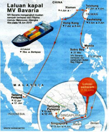
SIKAP HARIAN METRO