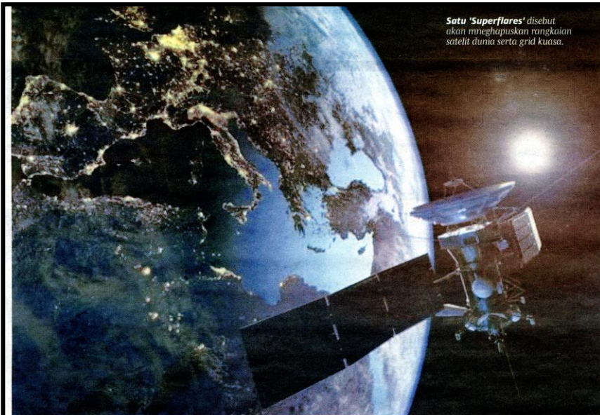
Satu 'Superflares' disebut akan menghancurkan rangkaian satelit dunia serta grid kuasa.