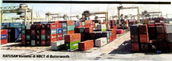
RATUSAN kontena di NBCT di Butterworth

Sebelum ini, Harian Metro pernah melaporkan sebanyak 265 kontena mengandungi sisa sampah dibawa masuk ke negeri ini dan masih tersadai di NBCT.