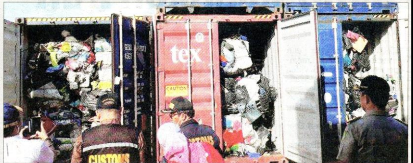
SEBAHAGIAN daripada 65 kontena mengandungi sampah plastik diperiksa pihak berkuasa Indonesia di pelabuhan Batuampar, Batam, kelmarin.

Isu lambakan sampah dari negara asing ke Indonesia pernah mendapat liputan meluas