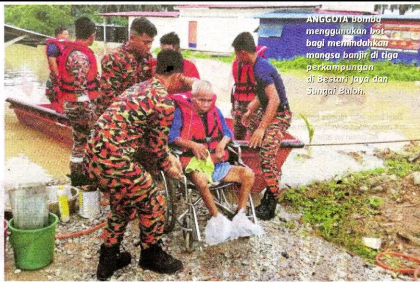
ANGGOTA bomba menggunakan bot bagi memindahkan mangsa banjir di tiga perkampungan di Bestari Jaya dan Sungai Buloh.