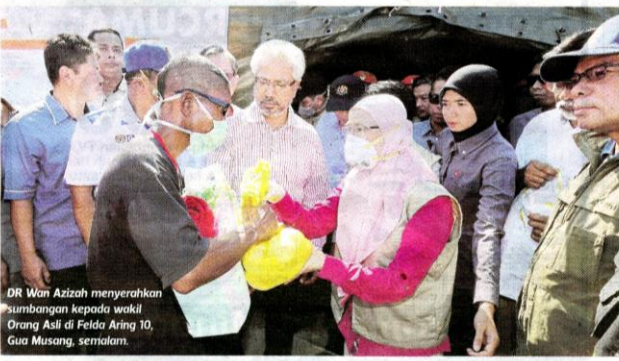
DR Wan Azizah menyerahkan sumbangan kepada wakil Orang Asli di Felda Aring 10, Gua Musang, semalam.