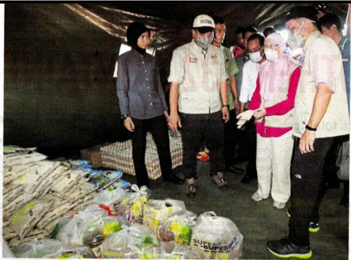
Deputy Prime Minister Datuk Seri Dr Wan Azizah Wan Ismail checking the food items that will be distributed to the families of the deceased Orang Asli tribesmen in Gua Musang yesterday.