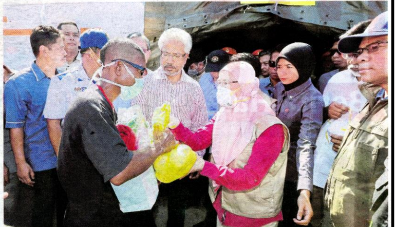
Dr Wan Azizah menyampaikan sumbangan kepada wakil Orang Asli Kuala Koh di FELDA Aring 10, Gua Musang, semalam.

Ketika ini, katanya, 49 penduduk masih dirawat di Hospital Gua Musang dan Hospital Kuala Krai (HKK) serta lima di Unit Rawatan Rapi (ICU) membabitkan seorang di Hospital Raja Perempuan Zainab II (HRPZII) dan empat lagi di HKK.